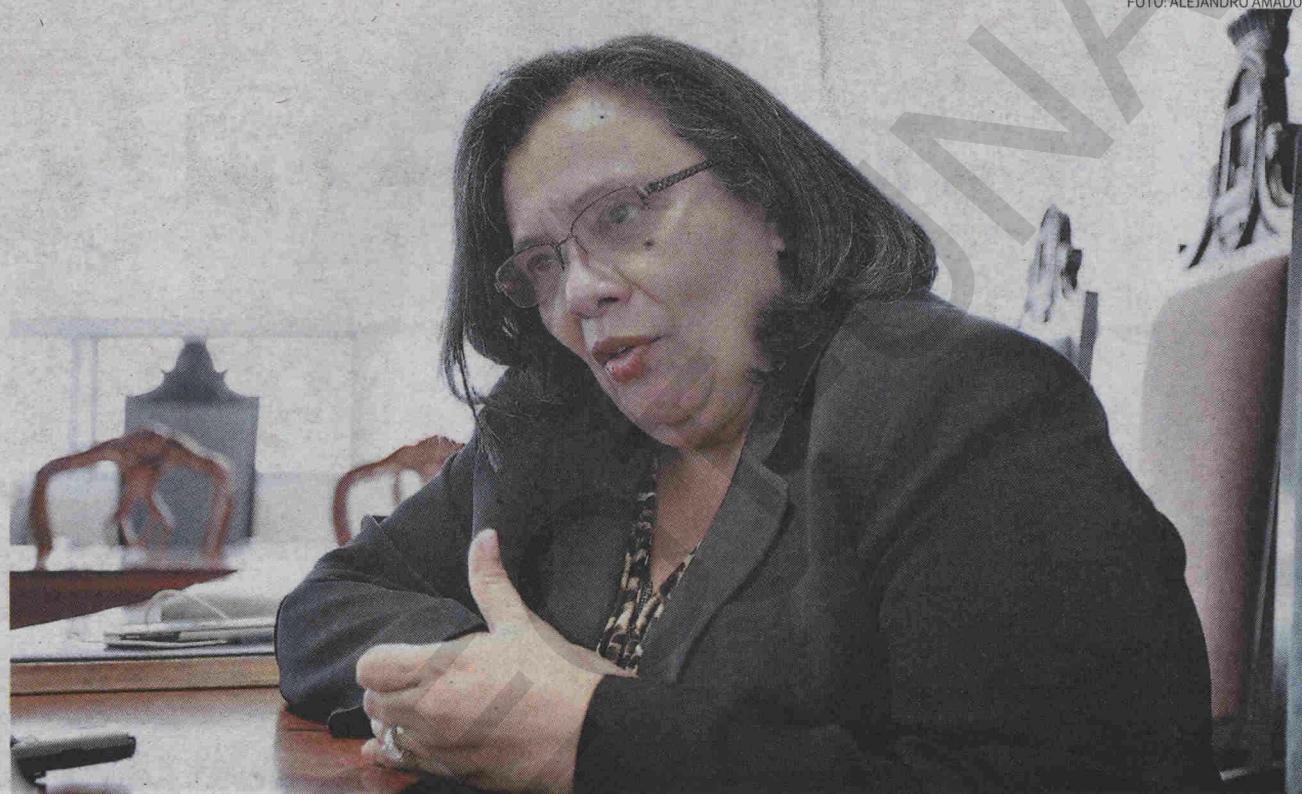
Julieta Castellanos, rectora de la Universidad Nacional Autónoma de Honduras (UNAH), en entrevista con EL HERALDO.

Yo creo que la razón de esta reforma universitaria la ha venido a dar la posición que está ocupando la UNAH en este momento. Antes de la reforma, la universidad no aparecía en ningún ranking, porque después del puesto número 300 no aparecen las universidades.