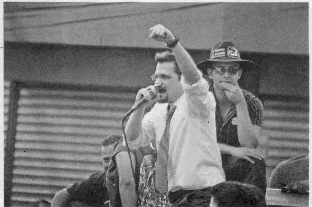
Diputados de la Alianza aprovecharon la movilización para dar sus discursos.