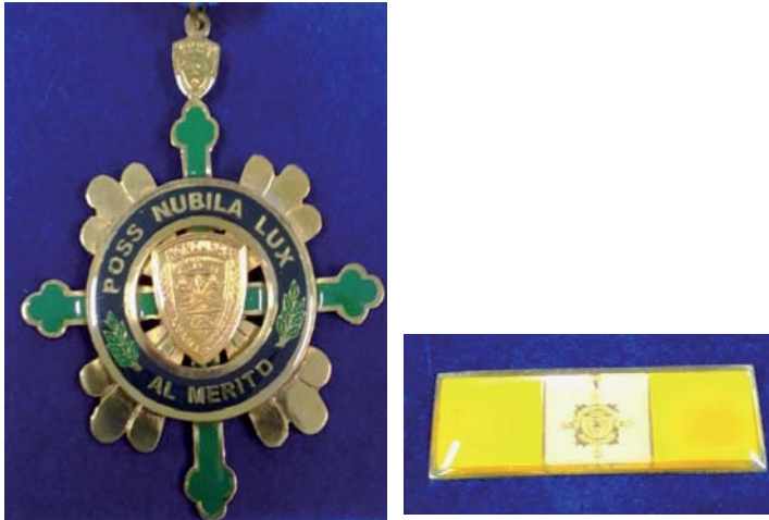
Medalla de “Catedrático Ejemplar”