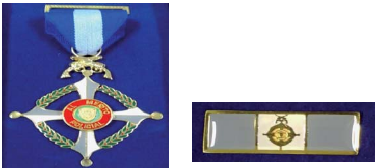
Condecoración “Cruz de los Servicios Distinguidos”

círculo de color verde perla de tipo convexo en el cual estará grabado con líneas doradas el monograma de la Policía Nacional, la joya penderá de una cinta de 70 mm de alto por 45 mm de ancho con tres banderas verticales. Esta condecoración constará de su respectivo gafete, con unas dimensiones de 30 mm de largo por 10 mm de ancho, y sus extremos de 10 mm, cada lado de esmalte azul y en el centro de esmalte blanco, con borde rojo a su alrededor y entre los espacios con divisiones de esmaltes; en la división blanca llevará una miniatura de la condecoración. La condecoración “ESTRELLA MERITO A LA UNIDAD POLICIAL” del color de la misma será impuesta en ceremonia especial que se realizará el día 09 de junio.