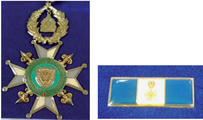
Condecoración “Gran Procer Marco Aurelio Soto”

General de la Policía Nacional previo informe del señor Subdirector de Bienestar Social, la cual será impuesta en ceremonia especial.