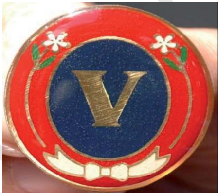
Distintivo Orquídea de Jade

El Distintivo Orquídea de Ópalo , consistirá en un círculo de 45 mm de diámetro, de color rojo y bordes dorados, llevando en su interior a cada lado una orquídea blanca, con dos hojas verdes y ramas doradas; en la parte inferior del círculo llevará un nudo blanco; en el centro del círculo estará un ópalo verde de 15 mm de diámetro con bordes dorados, en cuyo interior llevará una X en relieve y color dorado.