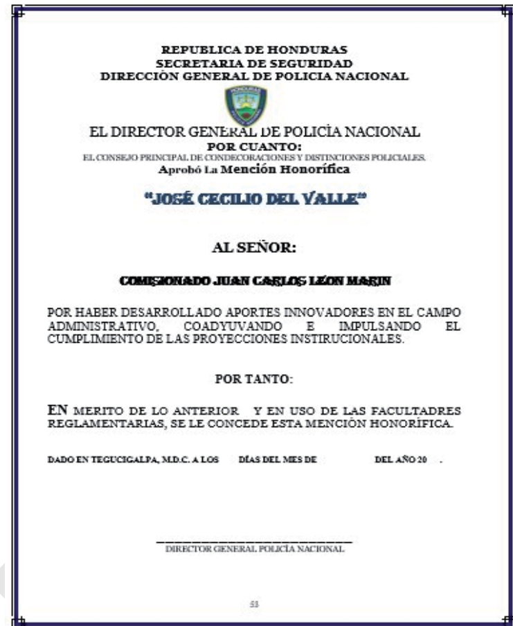
Mención Honorífica “José Cecilio del Valle”

La Mención Honorífica “Jose Trinidad Reyes” se acreditará a los funcionarios que hayan sobresalido con su destacada actuación en la planificación, organización, ejecución y supervisión de actividades culturales, sociales, deportivas o proyección comunitaria. Consistirá en un pergamino de excelente calidad con la impresión de fondo del Prócer en mención con las siguientes dimensiones 14 pulgadas de alto por 11 de ancho.