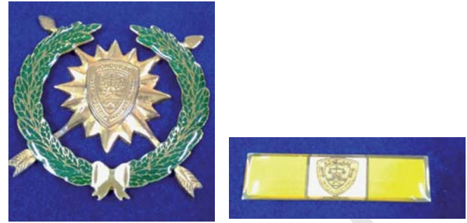
Medalla de Perseverancia en el Servicio en Bronce