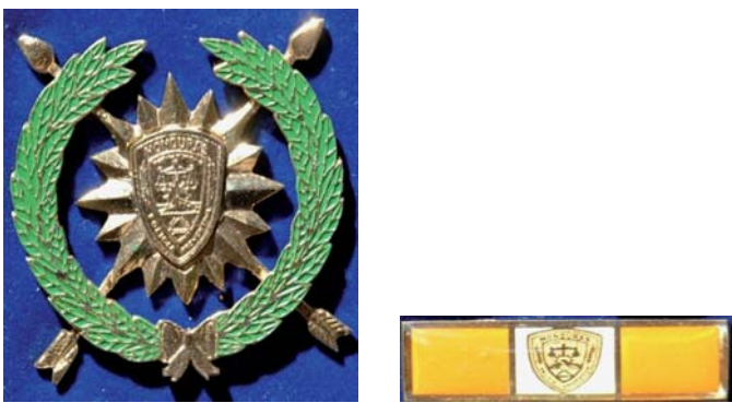
Medalla de Perseverancia en el Servicio en Oro

mm, en cuya intersección estará un sol de 45 mm color plata, con 16 aristas 8 mayores de 5 mm y 8 menores de 3 mm; en el centro estará un monograma de la Policía Nacional con un diámetro de 15 mm en color plata. Esta medalla constará de su respectivo gafete, con unas dimensiones de 30 mm de largo por 10 mm de ancho, dividida en 3 secciones de 10 mm cada una, de color plateado en los lados y en el centro de color blanco con borde de color verde con llevará una miniatura de la condecoración del mismo color, un monograma de la Policía Nacional de color azul con rayos de brillo dorados.