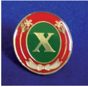
Distintivo Orquídea de Ópalo