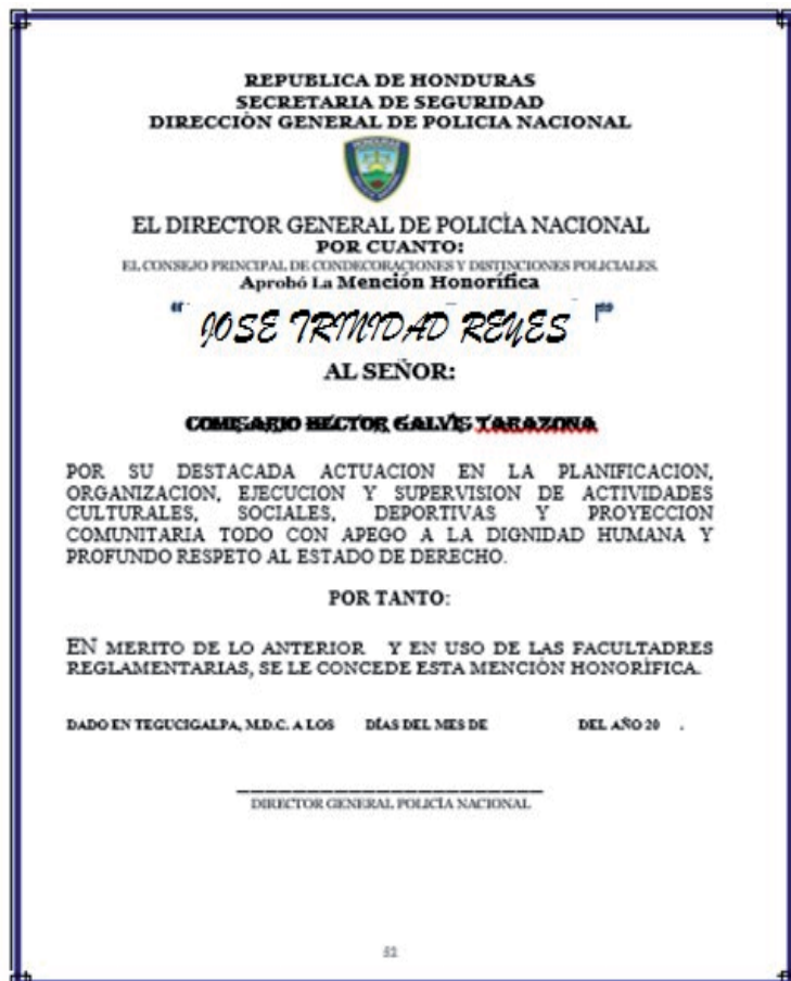
Mención Honorífica “José Trinidad Reyes”

demostradas en el cumplimiento de sus acciones éticas y morales, al igual que con su compromiso, disciplina y responsabilidad.