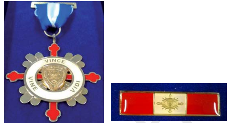
Medalla de " Honor a la Excelencia Académica "

Las Medallas PERSEVERANCIA EN EL SERVICIO (Oro, Plata y Bronce) serán impuestas en ceremonia especial que se realizará el día 15 de enero.