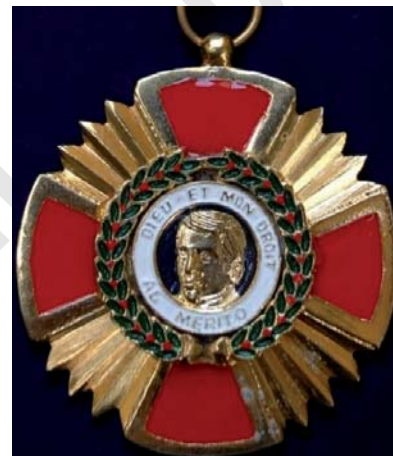
Condecoración “Procer Don Dionisio de Herrera”

La Condecoración “CRUZ DE LOS SERVICIOS DISTINGUIDOS” será impuesta al personal de la Policía Nacional de Honduras, en ceremonia especial que se realizará el día 15 de enero; para el personal de instituciones congéneres extranjeras será otorgada e impuesta por el señor Director General de la Policía Nacional según su criterio y en ceremonia especial.