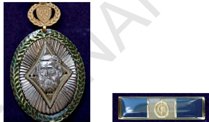
Condecoración “Procer Jose Trinidad Cabañas”

La Condecoración “ GRAN PROCER MARCO AURELIO SOTO ” será impuesta en ceremonia especial que se realizará el día 15 de enero.