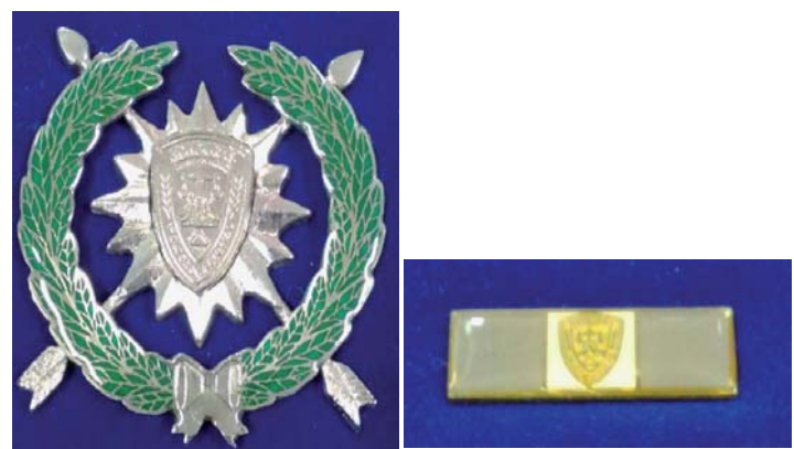
Medalla de Perseverancia en el Servicio en Plata

La Medalla de Perseverancia en el Servicio en Bronce consistirá en laureles color verde de 2 hojas en forma de U con 55 mm por extremo de color bronce, en su parte inferior llevará un nudo de 10 mm de color bronce con un par de flechas de 55 mm, en cuya intersección estará un sol de 45 mm color bronce, con 16 aristas 8 mayores de 5 mm y 8 menores de 3 mm; en el centro estará un monograma de la Policía Nacional con un diámetro de 15 mm en color bronce. Esta medalla constará de su respectivo gafete, con unas dimensiones de 30 mm de largo por 10 mm de ancho, dividida en 3 secciones de 10 mm cada una, de color bronce en los lados y en el centro de color blanco con borde de color verde con llevará una miniatura de la condecoración del color de la medalla, un monograma de la Policía Nacional de color amarillo con rayos de brillo dorados.