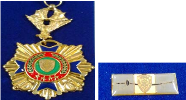
Condecoración “ Espadín Policial de Alto Honor en Oro ”

La condecoración “ PROCER JOSE TRINIDAD CABAÑAS ” será impuesta en ceremonia especial que se realizará el día 15 de enero.