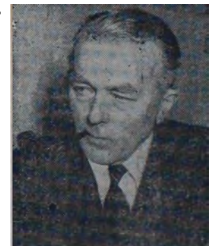
WILLIAM H. TUCK

Para la mayoría de nosotros la vida verdadera es la que no llevamos.—Oscar Wilde.