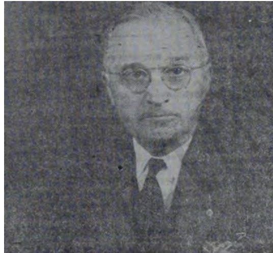
HARRY S. TRUMAN

En la jornada cívica del dos de los corrientes el gran pueblo Norteamericano eligió como su Presidente al insigne demócrata Mr. Harry S. Truman con más de veintidós millones de sufragios para el próximo período constitucional. Por medio del señor Embajador de los E. E. U. U. en Honduras nos permitimos enviar al Presidente electo y a la Gran Nación del Norte nuestra humilde pero cálida felicitación por el triunfo comicial alcanzado que involucra el triunfo de la democracia.