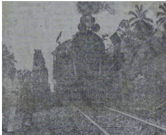
El "Tren de la paz" en Indonesia

Hace ya un año que el Comité de Buenos Oficios de las Naciones Unidas viene actuando en Indonesia con el fin de ayudar a negociar un acuerdo entre la nueva República de Indonesia y el gobierno holandés. Para asegurar la imparcialidad, las negociaciones se llevan a cabo en ambos territorios, alternándose tres semanas en cada uno. Un tren especial transporta a los delegados entre Jogjakarta, capital de la República, y Batavia, capital de los holandeses. Muéstrase en la foto la locomotora del "Tren de la Paz" cruzando el puente que divide oficialmente a los dos territorios.