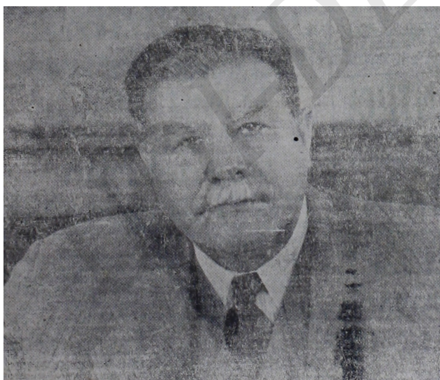
Dr. y General don Tiburcio Carías Andino, Jefe Supremo del Partido Nacional. Ex-Presidente de la República, que confundido con sus conciudadanos, recibe la ovación desinteresada, libre y cariñosa de éstos y es tal el concepto, estima y admiración de su pueblo, que su nombre es símbolo de patriotismo, que hace recordar a los varones justos y sabios de la antigua Grecia y Roma.