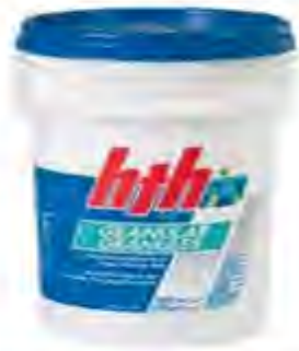
HIPOCLORITO DE CALCIO GRANULAR AL 65%