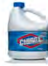
HIPOCLORITO DE SODIO LIQUIDO AL 3% AL 5%

➤ Elaboración de Solución madre al 1% (10,000 mg/l), con Hipoclorito de calcio al 65%