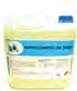
HIPOCLORITO DE SODIO LIQUIDO AL 8% AL 10%