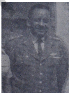
Gral. López Arellano

El momento difícil por el cual atraviesa nuestra querida Patria, necesita del concurso unido y desinteresado de todos los hondureños; se enfrenta a un problema de tipo internacional que atenta contra su soberanía, como ser, la agresión cobarde y traidora de que fue objeto de parte de los vecinos de allende el Goascorán que con intentos descabellados pretenden resolver sus problemas internos a costas del sacrificio soberano de nuestro país; que intensivamente realizan incursiones violatorias a nuestro territorio, que solo dejan como resultado, la muerte e intranquilidad de los