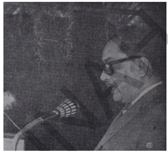
Genl. Oswaldo López Arellano

De ello debemos tener plena seguridad, a pesar de las maniobras turbias y las misas satánicas en que —según se dice por ahí— ofician ciertos "activistas" que, acatando consignas extrañas y antipatrióticas, se trata vanamente de restarle importancia y echar a perder aquella gloriosa gesta librada mancomunadamente por nuestro Pueblo, Ejército y Gobierno.