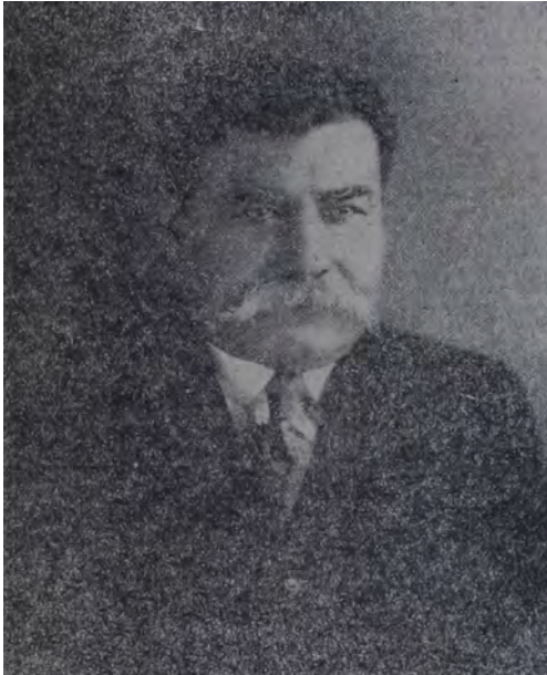
Dr. y Gral. Tiburcio Carías A Candidato a la Presidencia por el Partido Nacional

Elegid Pueblo Hondureño a vuestro futuro Gobernante con la mayor cultura cívica