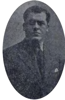
Dr. Angel Zúñiga Huete Candidato a la Presidencia por el Partido Liberal