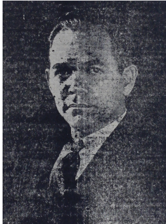
Ingo. y Gral. Abraham Williams Candidato a la Vice-Presidencia de la República para el período de 1933 a 1937

Debido a las pequeñas dimensiones de nuestro semanario, no nos es posible darle cabida a todo el material que nos llega, como lo deseamos con tan buena voluntad. Así las cosas; y no pudiendo por falta de dinero, subsanar el motivo expuesto, nosotros les rogamos dispensar la tardanza con que se mueve este semanario, con poco espacio y con correos de servicio irregular.