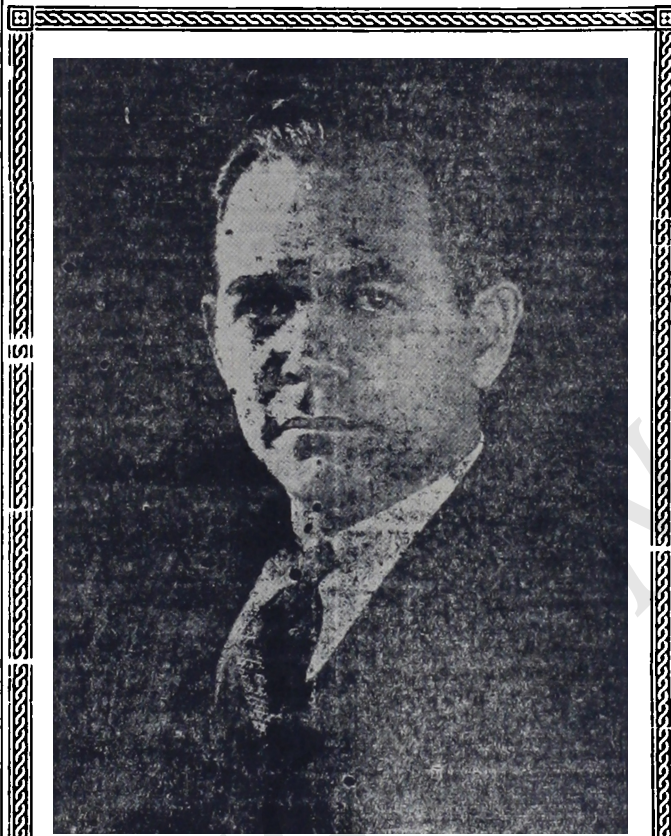
Ingo. y Gral. Abraham Williams Candidato a la Vice-Presidencia de la República para el período de 1933 a 1937

listas que bregan por la candidatura Carías-Williams, llamada por hecho y por derecho a enderesar la caída de Honduras en una administración desordenada y triste.