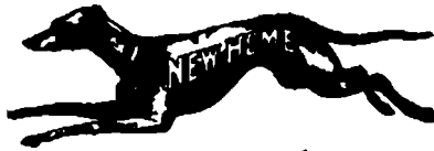
figura de un perro corriendo —de la clase llamada galgo— en uno de cuyos lados se ve la palabra "NEW HOME," la compañía la emplea en las máquinas de coser y accesorios referidos; y la que emplea en el hilo es la palabra NATIONAL

Dichas marcas han sido registradas en Oficina de Patentes de Estados Unidos el 3 de mayo de 1899 y el 29 de diciembre de 1903 y bajo los números 33,010 y 41,795, respectivamente. Lo que se publica para los fines de ley.—Tegucigalpa: 5 de octubre de 1907.