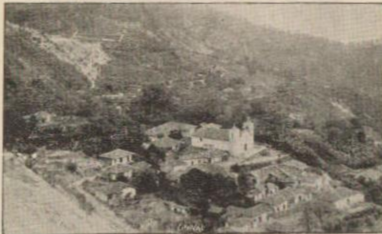
Otra vista de San Antonio de Oriente tomada del rumbo suroeste del punto llamado "Las Cruces".