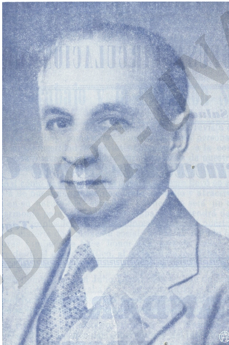
Excmo. Don Julio Lozano Díaz JEFE SUPREMO DEL ESTADO

Por la Armonía entre EL CAPITAL Y EL TRABAJO —————→ ←————— Por la Cultura y el Binestar Social de Honduras