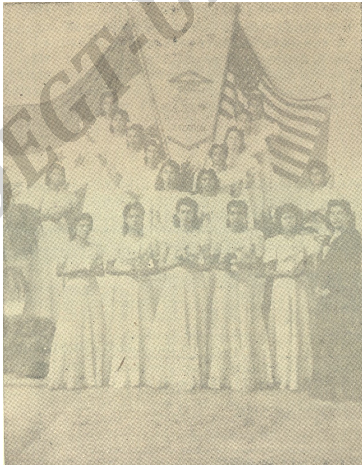
Grupo de alumnas que después de 9 meses de clases, recibieron sus Diplomas de Corte y Confección «Creación», en solemne acto público, el 12 de febrero de 1944. Al cumplirse el primer aniversario—varias de ellas enviaron flores a su Profesora, que mucho se las agradece.