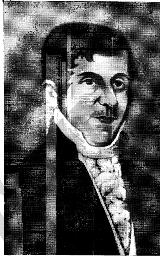
Lic. Juan Nepomuceno Fernández Lindo y Zelaya Fundador de la Universidad Nacional de la República de El Salvador, según decreto firmado el 16 de febrero de 1841. 1790 1857