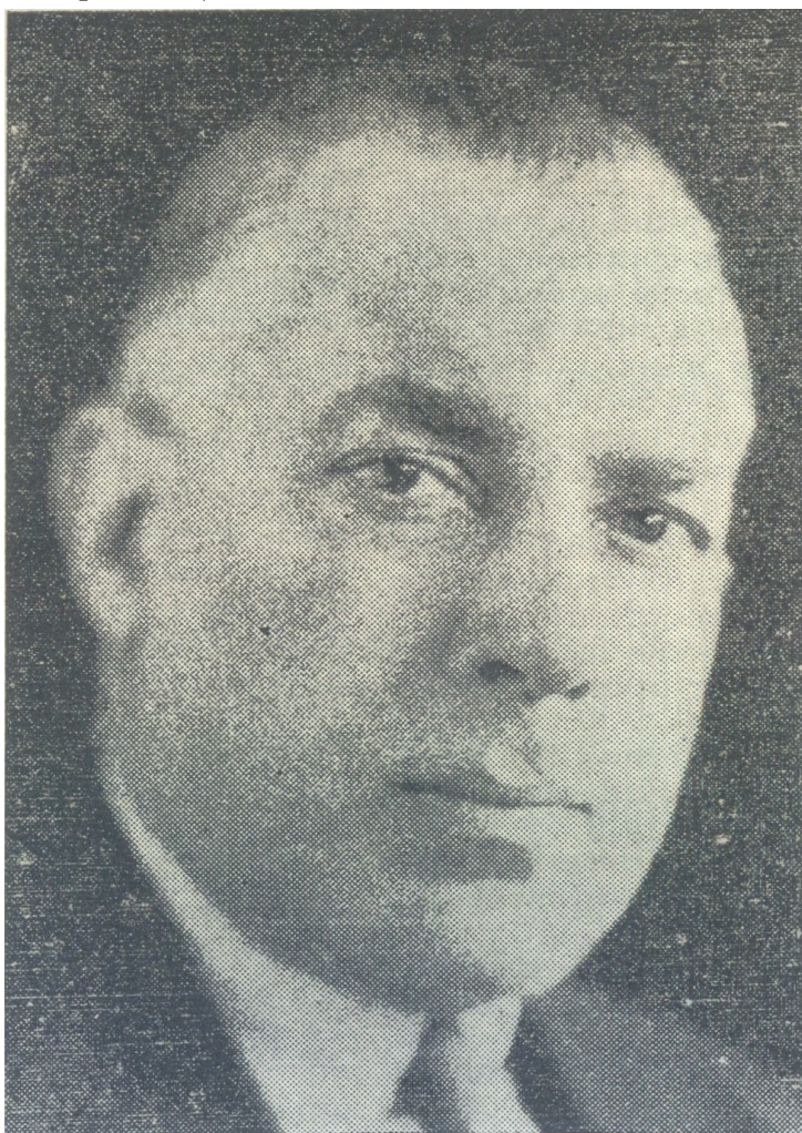
Enviado Extraordinario y Ministro Plenipotenciario ante el Gobierno de Honduras

Y nuestro reconocimiento al Excelentísimo señor Presidente de la República de Honduras, Doctor y General don Tiburcio Carías Andino,