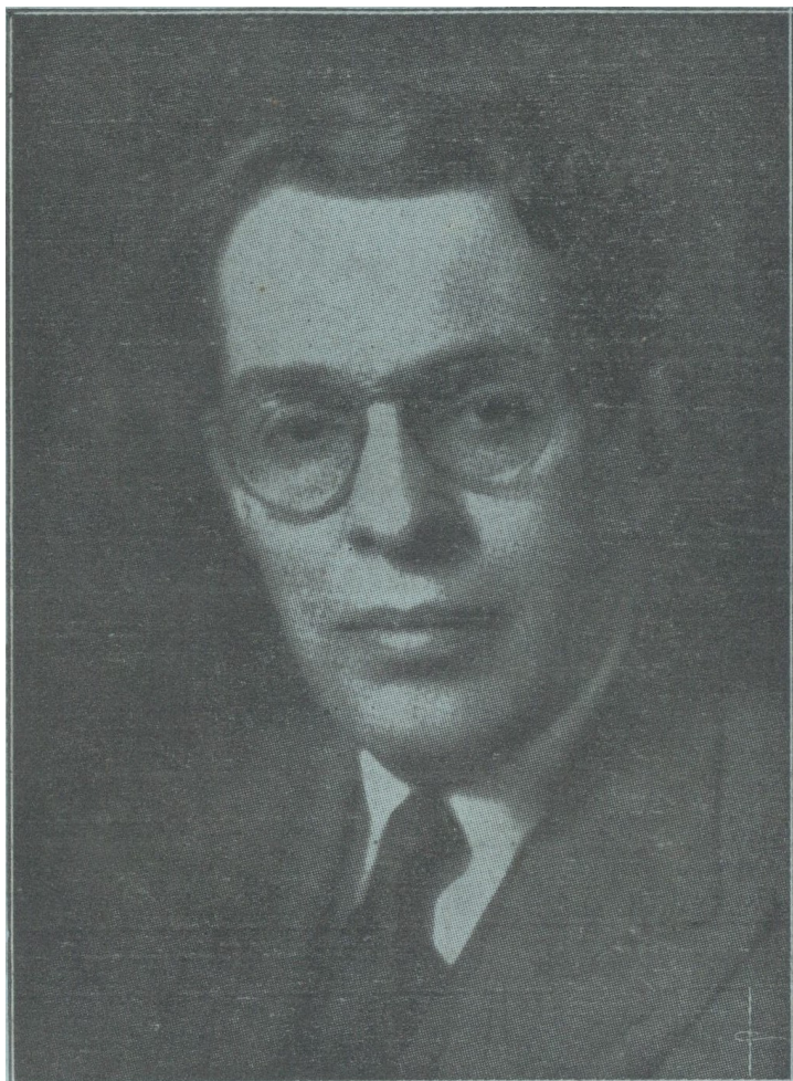
EXCMO. SEÑOR DR. EDUARDO SANTOS Presidente Constitucional de la República de Colombia