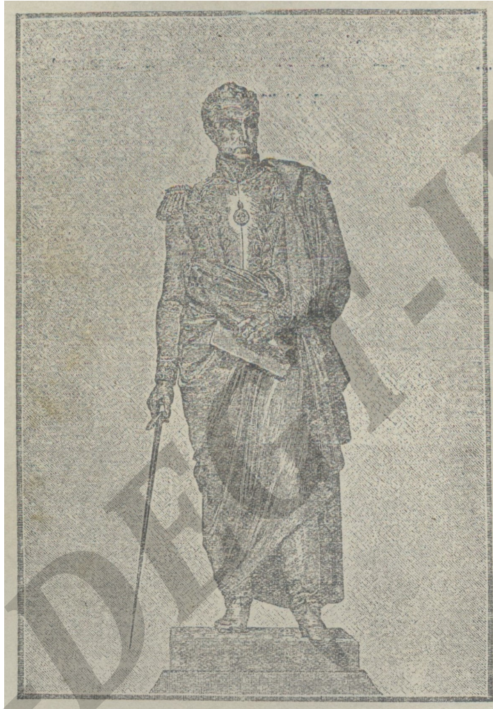
LIBERTADOR SIMON BOLIVAR