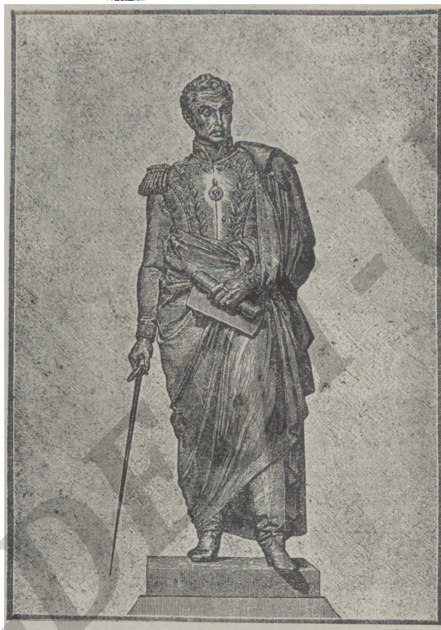
LIBERTADOR SIMON BOLIVAR