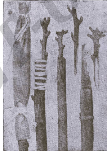
INJERTO DE CORONA

Para la mayoría de los árboles frutales tropicales este método de propagación es el mejor. A la derecha del grabado se ven ramas de donde pueden cortarse yemas, y un escudete debidamente cortado, y a la izquierda el mismo escudete insertado en el patrón, y cerca del cuchillo el escudete ligado con una tira encerada.