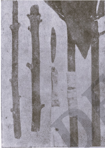
INJERTO DE ESCUDETE

USTED PUEDE INJERTAR GUIANDOSE POR ESTOS GRABADOS