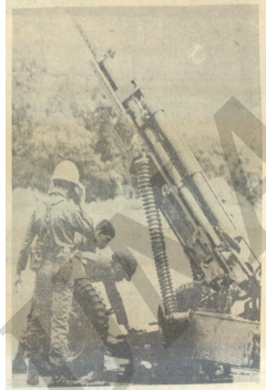
Parte de los soldados hondureños especializados en artillería manejan un obús recién comprado por Honduras a los Estados Unidos.