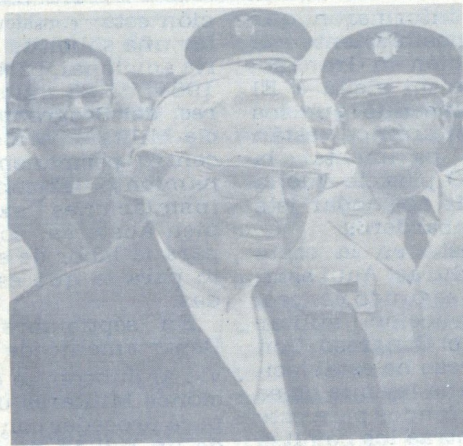
EL EJEMPLO DE MONSEÑOR ROMERO

Hablando ante el gabinete de gobierno, el prelado condenó lo que dio en llamar "materialización de la sociedad hondureña imbuída en el consumismo" e hizo un llamado para que la paz prevalezca en la Nación. (LT/4/2/84)