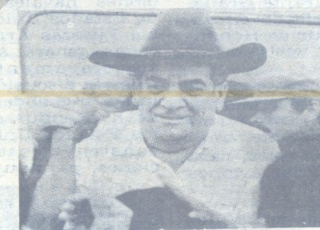
ROBERTO SUAZO CORDOVA

Suazo Córdova recomendó a los políticos de cualquier tendencia que no traten de ir a los cuarteles a fin de politizar a los militares. "El ejército, añadió, debe mantener su unidad granítica, dedicado única y exclusivamente a la defensa de la integridad territorial, la soberanía y mantener la plena tranquilidad del pueblo". (H/4/4/84)