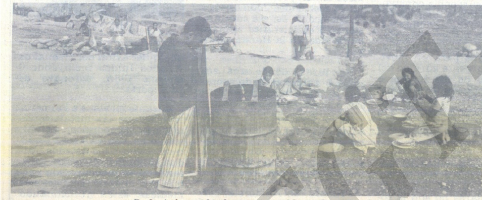
Refugiados salvadoreños en Mesa Grande.

Mientras los preparativos para el éxodo se intensifican, se denunció el hallazgo de 14 cadáveres de salvadoreños en una aldea del departamento de