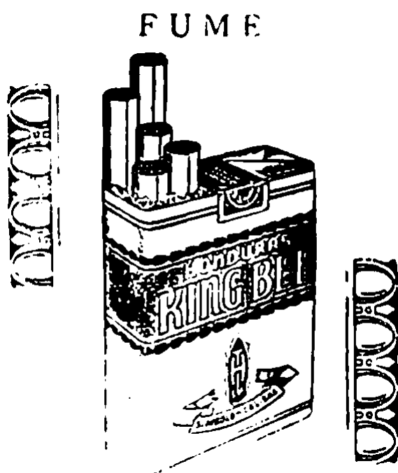
REY DE LOS CIGARRILLOS

San Vicente de Paúl puso como resumen y lema de su vida estas palabras: "Me envió a evangelizar a los po- bres. Sus obras de caridad, su vida de heroica virtud, obedecieron fielmente a es- ta llamada. Santa Teresita de Jesús decía: "Quiero pa- sar mi cielo haciendo bien en la tierra". Por eso lo más pequeño, lo más insignifi- cante, toda su infancia espi- ritual, se fijaba en su pro- grama, y lo convertía en bien, en ocasión de mortifi- cación y virtud. Y San A- gustín, (el santo más citado según el refrán español que dice: Toda buena casa con- tiene una bodega y todo ser- món bueno una cita de San Agustín) nos dice: "Ama y