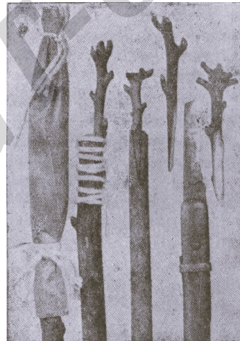
INJERTO DE CORONA

Para la mayoría de los árboles frutales tropicales este método de propagación es el mejor. A la derecha del grabado se ven ramas de donde pueden cortarse gemas, y un escudete debidamente cortado, y a la izquierda el mismo escudete insertado en el patrón, y cerca del cuchillo el escudete ligado con una tira encerada.