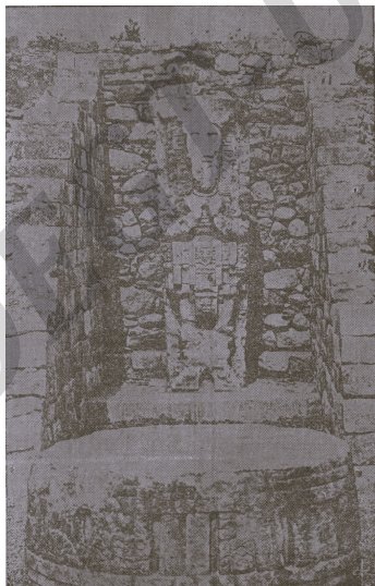
Ruinas de Copán.—Estela I vista de frente con su altar.