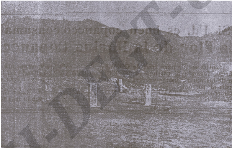
— Vista del este a travez de la plaza mayor. — Ruinas de Copán,

Jefe del Departamento de investigaciones Históricas de la Institución Carnegie de Washington D. C.