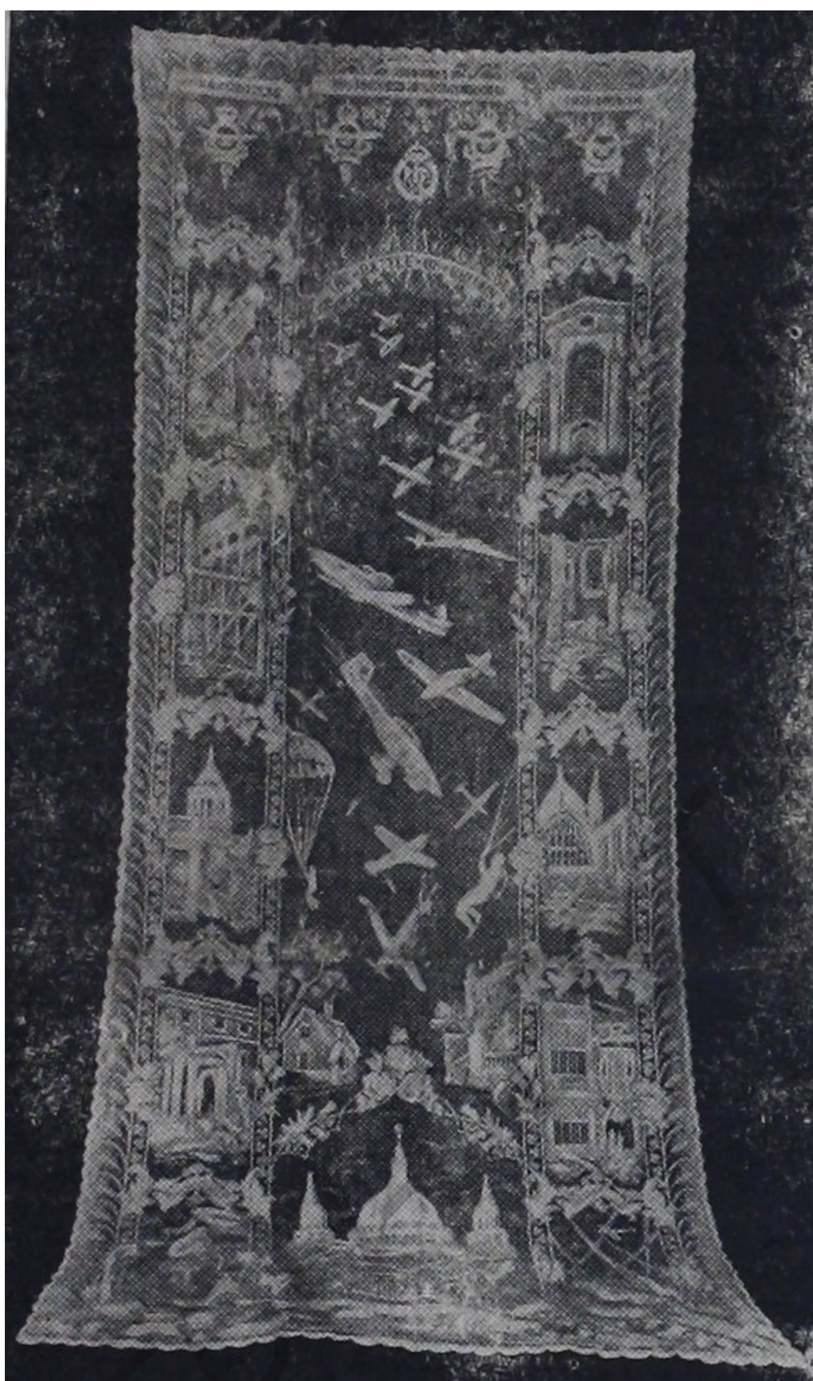
Presentamos una foto de uno de los diseños que conmemoran "La Batalla de Inglaterra" durante la Feria de Industrias Británicas, que se celebrará simultáneamente en Londres y Birmingham, durante la semana del 2 al 12 de mayo del presente año.