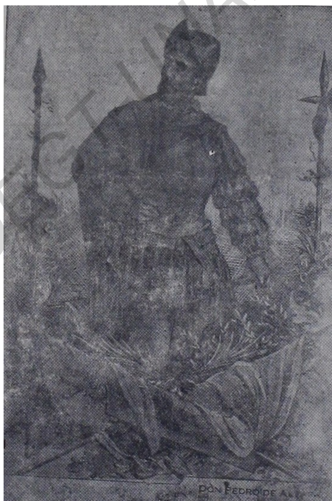
EL ADELANTADO DON PEDRO DE ALVARADO,

quien en el año de 1736 fundó la VILLA DE SAN PEDRO DE PUERTO CABALLOS, que hoy es nuestra populosa ciudad de San Pedro Sula y que por mil razones debemos esperar que sea la gran urbe industrial y comercial de Honduras en futuro cercano. Con ocasión del nuevo aniversario de su fundación esta ciudad rinde memoria a su fundador.