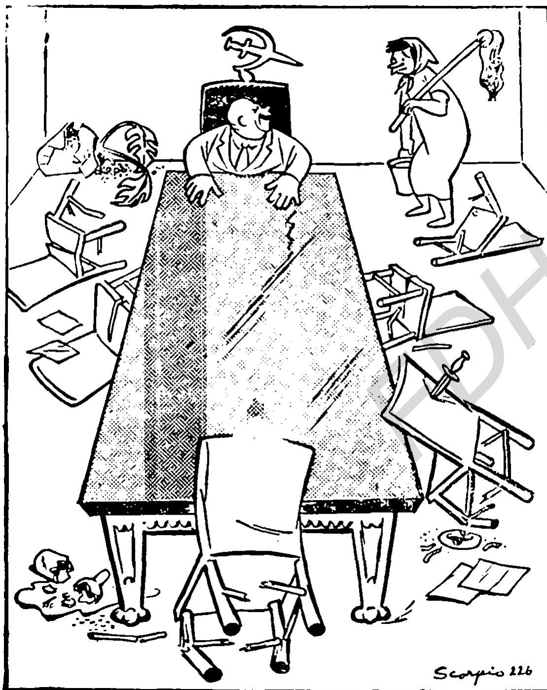
"A esto es lo que yo llamo dirección colectiva"