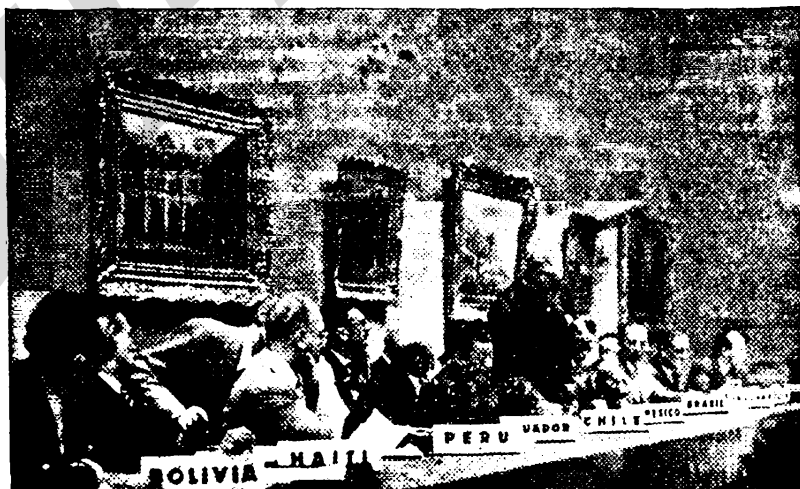
Delegados a la Conferencia Interamericana sobre Problemas de la Guerra y de la Paz, disienten en el Castillo de Chapultepec, Ciudad de México, los principales problemas que se plantearán en las sesiones. De pie, el Dr. Francisco Castillo Nájera, Embajador de México en los Estados Unidos.