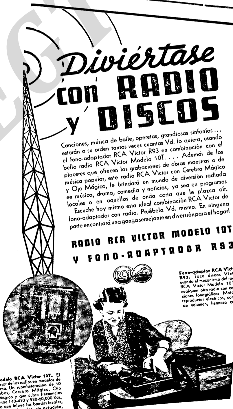
Modelo RCA Victor 10T. El mejor de los radios en modelos de mesa. Un superheterodino de 10 tubos, Cerebro Mágico, Ojo Mágico y que cubre frecuencias entre 140-410 y 530-60,000 Kcs., lo que incluye las bandas locales, internacionales, de aviación, policia y aficionados.

RADIO RCA VICTOR MODELO 10T Y FONO-ADAPTADOR R93