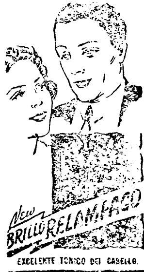
EXCELENTE TONICO DEL CASERO.

SALVADOR HANDEL Los tintos de las Niveles