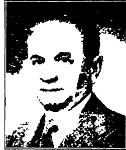
P. M JULIO LOZANO

Populares Candidatos a la Presidencia y Vice Presidencia de la República