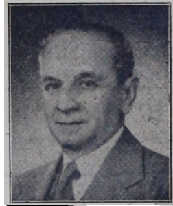
DR. JUAN M. GALVEZ