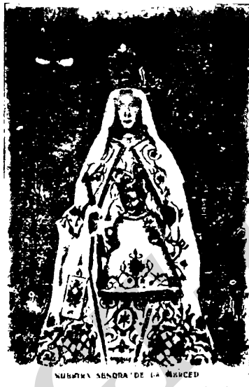
SEÑORA SEÑORA DE LA MERCED

Como un homenaje de respeto, devoción y admiración, traemos para nuestros lectores, la bella imagen de la Virgen de las Mercedes, sublime patrona de los progrenos, en ocasión a las celebraciones religiosas que se están llevando en nuestra Iglesia Católica, con motivo de la fecha designada para brindarle tributo con cordura, gracia y esperanza.