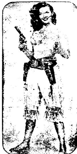
«EL CARA PALIDA»