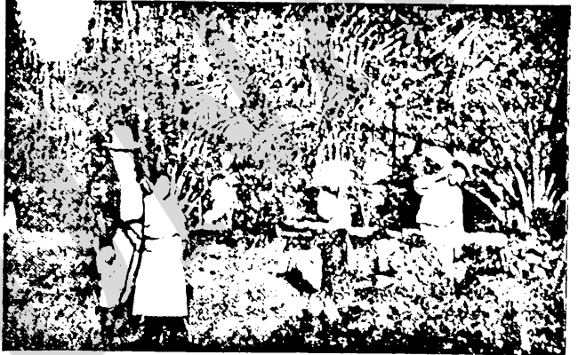
Corte y Selección de los racimos Para la producción del Famoso Aceite de Palma de Malaya