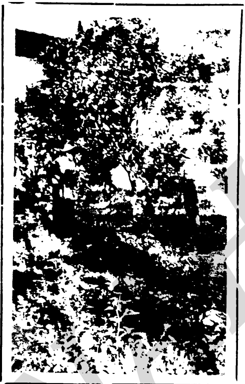
Bañando las Plantas con baño del liquido Bodeos, para matar la caspa en una plantación de naranjo en la Escuela Granja de Birichiche.

LA CASA QUE SALVAGUARDA SU SALUD.: Si quiere Ud que sus medicamentos estén garantizados por el escrupulo y la precisión con que deben despacharse, acuda a la FARMACIA PROGRESERA del Dr. A. Bennaton Jr., en donde además de un trato siempre atento encontrará Ud. en todo, buena calidad y eficacia. LA FARMACIA PROGRESERA vende solo lo mejor y a precios mas bajos de la localidad. Sea Ud. nuestro cliente y se convencerá