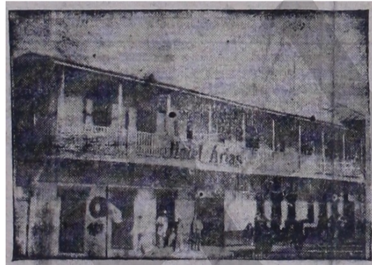
HOTEL ARIAS LA CEIBA

Piensa Ud. disfrutar de la FERIA ISIDRA Pues, su mejor alojamiento y comodidad