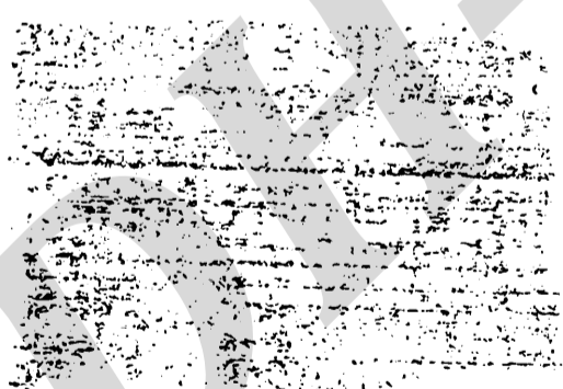
HOTEL ARIAS LA CEIBA

Piensa Ud. disfrutar de la Feria Isidra Pues, su mejor alojamiento y comodidad