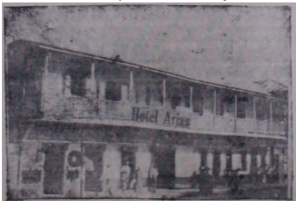
HOTEL ARIAS LA CEIBA