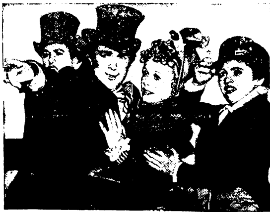
Una bellissima escena del grandioso estreno de las mas asombrosas de las peliculas de Aventuras.