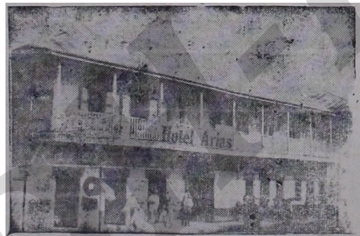
HOTEL ARIAS LA CEIBA

Piensa Ud. disfrutar de la Feria Isidra Pues, su mejor alojamiento y comodidad