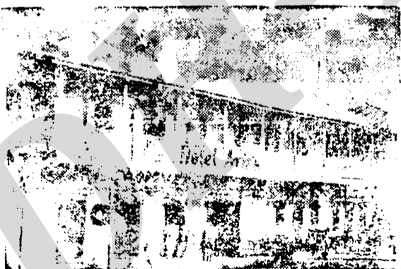
HOTEL ARIAS LA CEIBA

Piensa Ud. disfrutar de la Feria Isidra Pues, su mejor alojamiento y comodidad