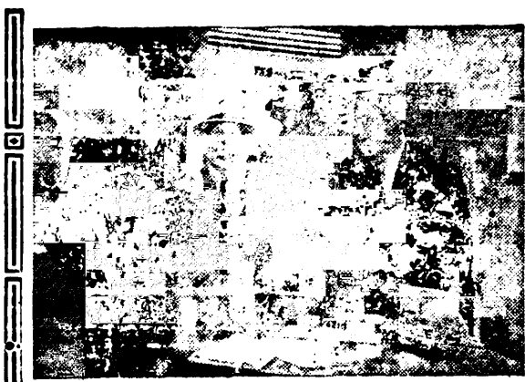
Una interesante escena de la película en español EL ULTIMO ENCUENTRO, que se estrenará HOY