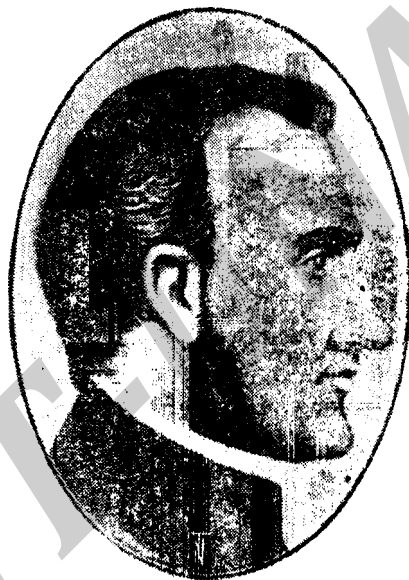
GENERAL FRANCISCO MORAZAN HEROE DE LA TRINIDAD