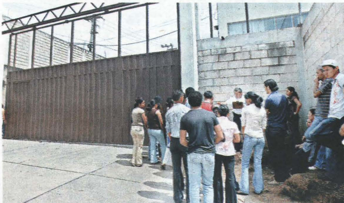
MAQUILAS. Los empleados de las maquilas acudieron a sus centros de trabajo de forma normal en la ciudad capital.

En la capital son más de 395,582 personas las que a diario salen de sus hogares para incorporarse a las jornadas de trabajo; en San Pedro Sula, unos 300 mil trabajadores acuden diariamente a sus empleos. La mayoría de la masa laboral ha permanecido cumpliendo con sus funciones en las diferentes empresas.