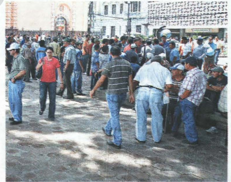
PLAZA. En la plaza Central, centenares de personas de la tercera edad se apostaron para conversar sobre la paz.