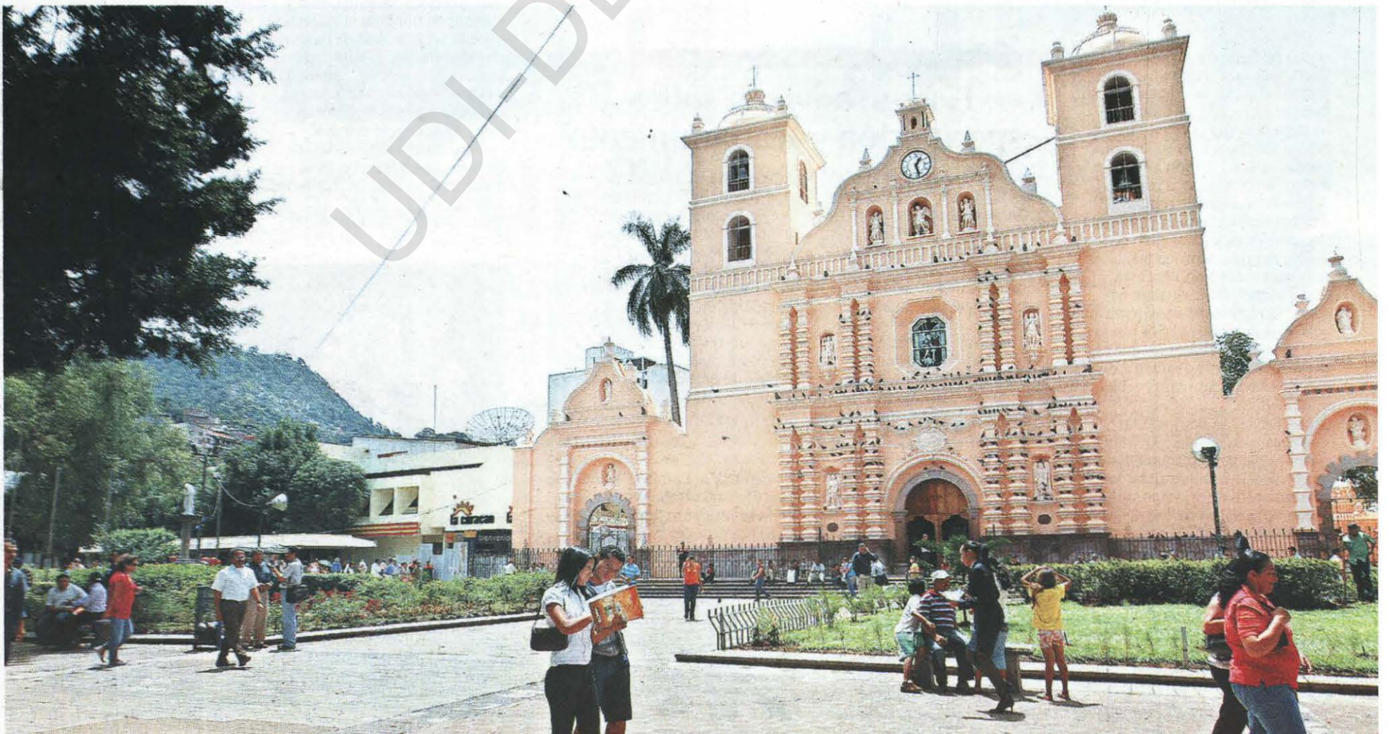
TRANQUILIDAD. Las labores en la capital comenzaron desde las primeras horas de la mañana, pues reinó la tranquilidad acostumbrada.