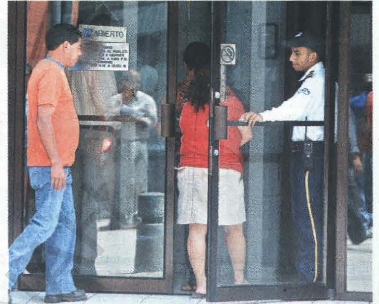
BANCOS. Las agencias bancarias mantuvieron sus horarios de atención al público.