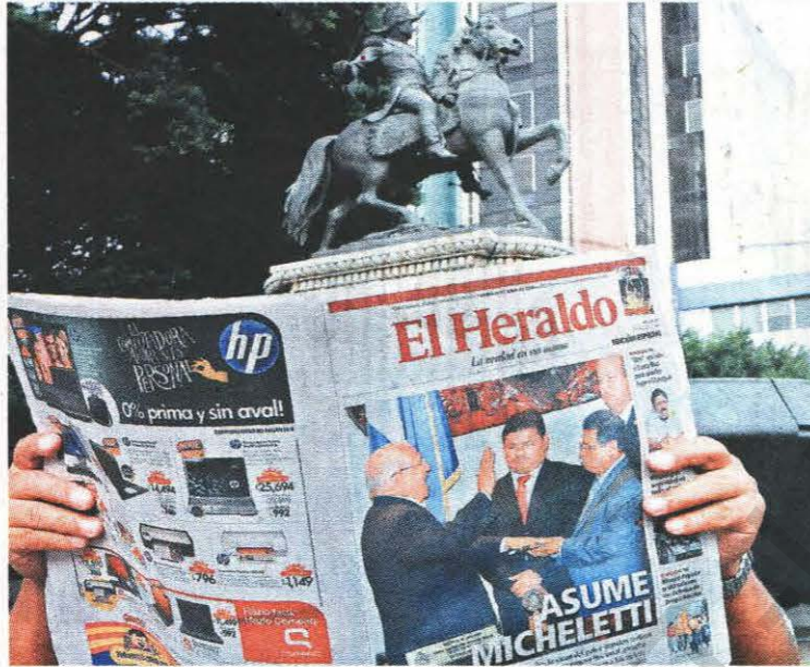
Asunción. Roberto Micheletti asumió la Presidencia de la República en sustitución de José Manuel Zelaya Rosales.

T egucigalpa. La separación del presidente José Manuel Zelaya Rosales ha generado opiniones encontradas entre la población. Sin embargo una gran mayoría coinciden en que el hecho no se puede calificar como un golpe de Estado cuando hay un mandatario en funciones que no es militar. Lo que ocurrió el domingo en horas de la mañana es un proceso de transición debido a que el ex presidente desobedeció las disposiciones emanadas del Poder Judicial que declaró como ilegal la consulta popular. La mayoría de los capitalinos consultados vivió momentos difíciles ya que recordaron los golpes de Estado que se generaron en el pasado y las consecuencias que estos trajeron para el ciudadano común. Afirmaron que si lo que ocurrió