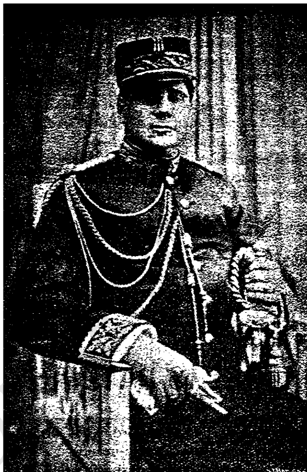
General Federico Tinoco

perpetua contra el indiferentismo que los rodea y asfixia, como los anillos constrictores de monstruosa sierpe.