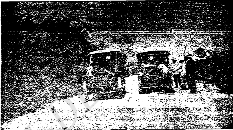
CARRETERA DEL SUR—HONDURAS

broma cacao , palabra que se descompone en griego en dos: Theo , Dios, y broma , manjar, que, en conjunto, significa manjar de los dioses. Desde tiempo prehistórico se cultivaba esta planta por los indígenas, en toda la América tropical, consiguiéndose mejores calidades en Méxi-