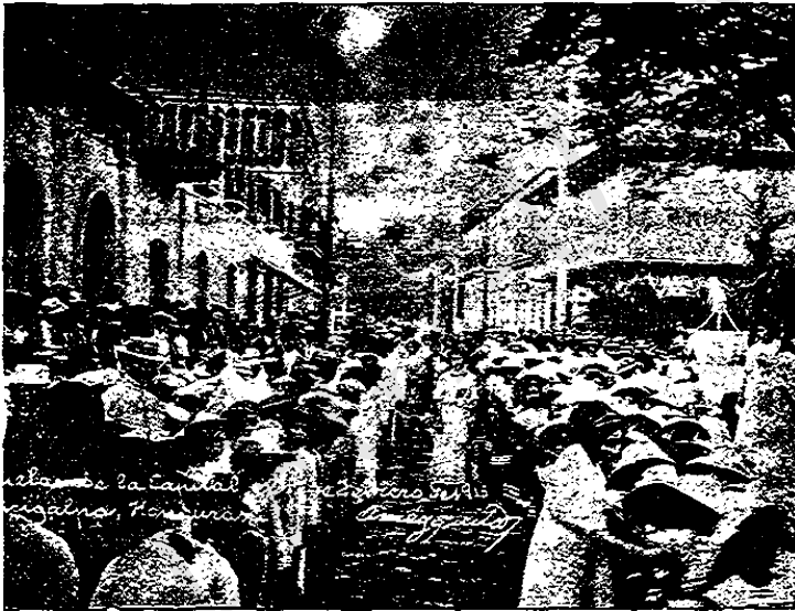
ESCUELAS DE LA CAPITAL

sedantes encajes del recuerdo, por cuyas calles, sembradas de verdes amarantos, paseó su espada invicta y legendaria y sus pupilas rutilantes de triunfos y de glorias el insigne Garibaldi; en donde la diestra marmòrea de Carlos III deja traslucir todavìa su ademàn imperativo para la vieja Al-