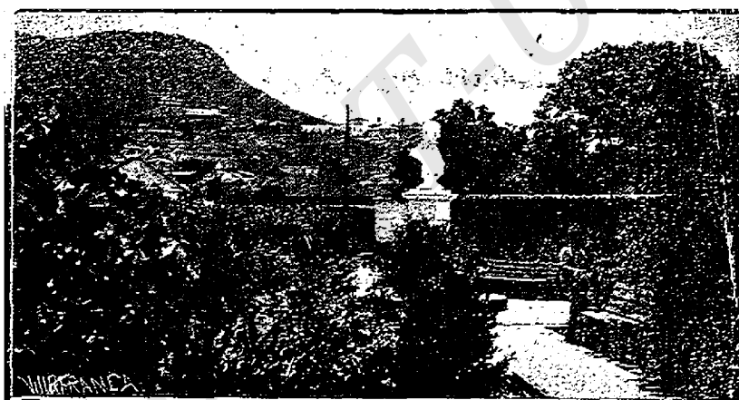
PARQUE DIONISIO DE HERRERA.—TEGUCIGALPA, HONDURAS

Raramente se encuentra en los azares de la vida algo más diáfa-