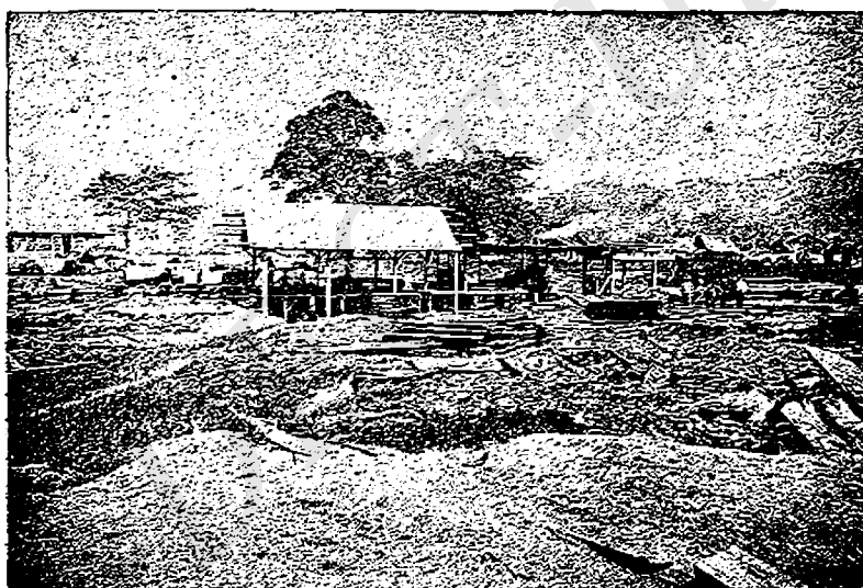
ASERRADERO.—CUYAMEL.—DEPARTAMENTO DE CORTÉS HONDURAS