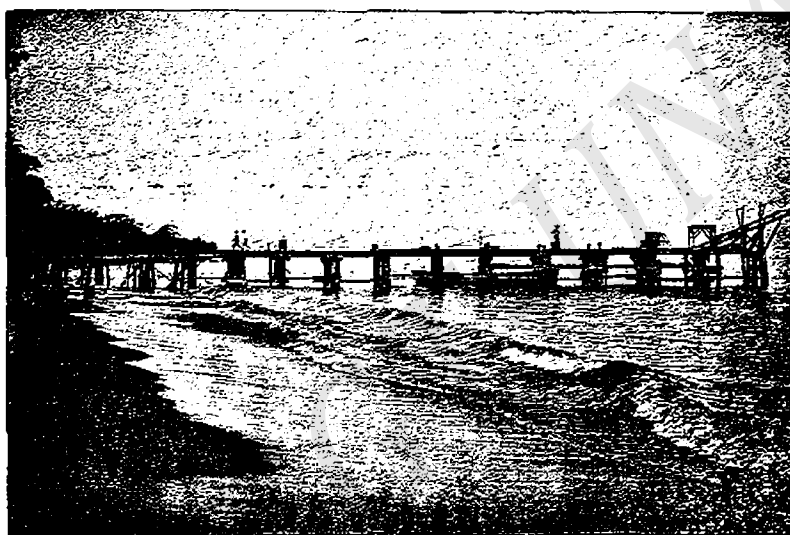
MUELLE DE VERACRUZ, CUYAMEL, DEPARTAMENTO DE CORTÉS HONDURAS