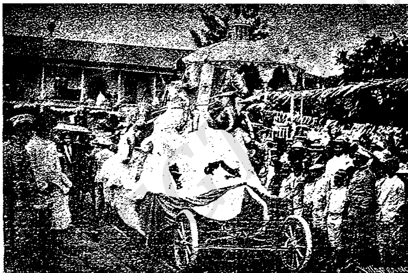
CARROZA ALEGÓRICA QUE RECORRIÓ LAS CALLES EN LAS FIESTAS PATRIAS.—TEGUCIGALPA, HONDURAS

Han desfilado en esta controversia, además de los personajes